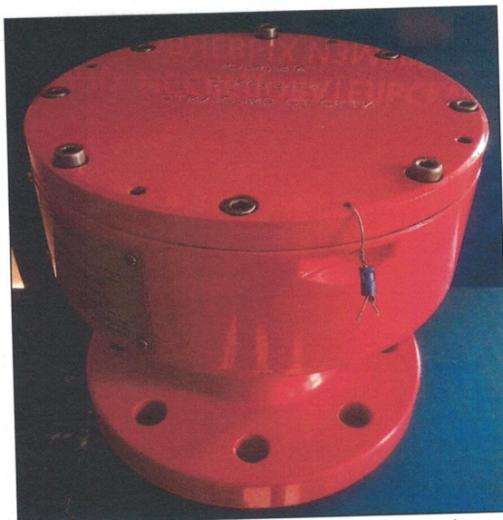
Рисунок 2 – Место пломбировки уровнемеров многофазных серии УМФ300